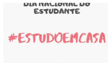
EstudoEmCasa é o repto lançado pelo Ministério da Educação aos