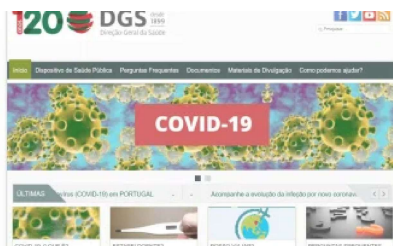
Direção Geral de Saúde lança microsite sobre coronavírus