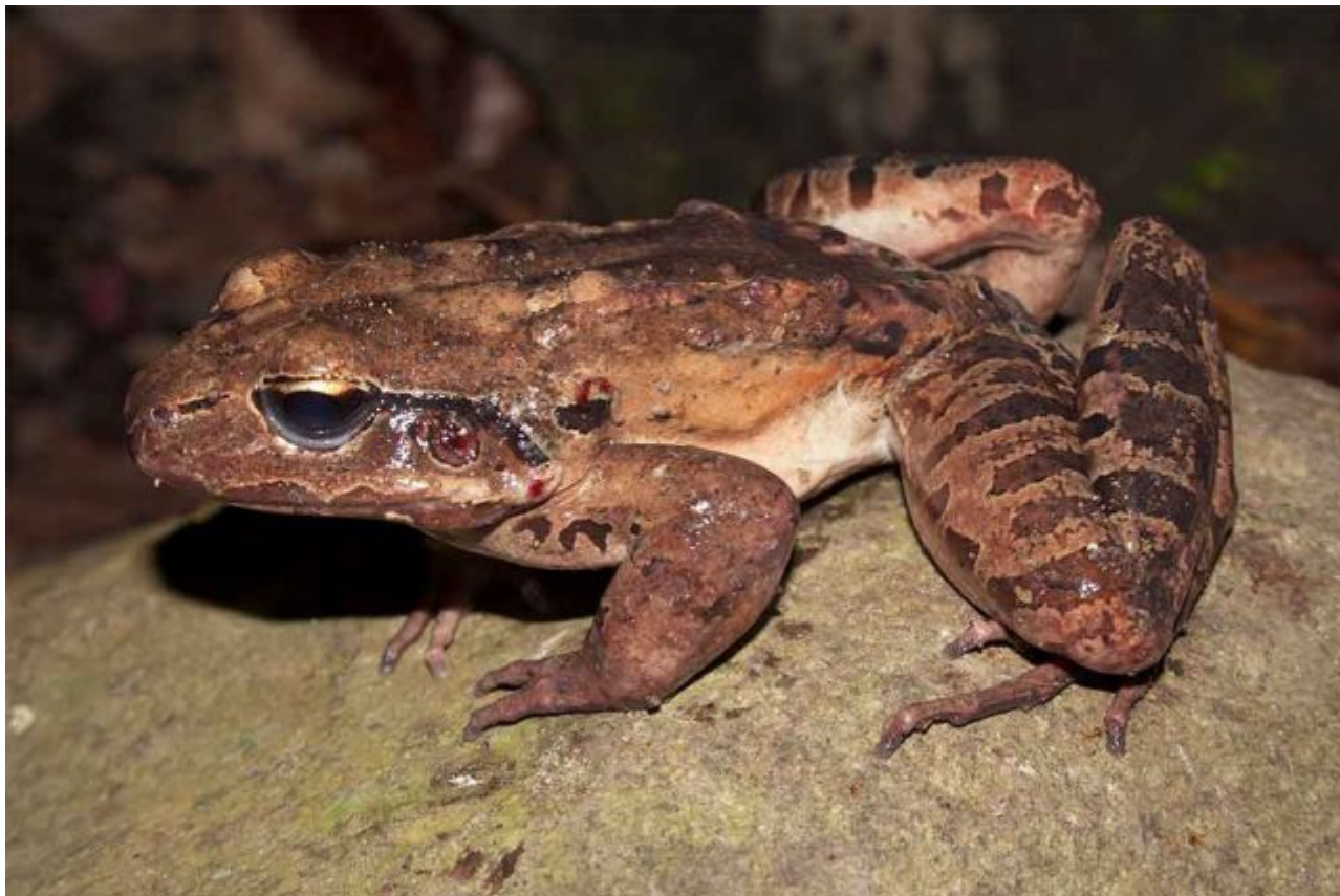
Indivíduo de galinha-da-montanha ( Leptodactylus fallax ) com quitridiomicosose na ilha de Montserrat, onde a populações foi empurrada para a beira da extinção