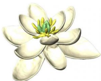
Modelo tridimensional da flor ancestral original